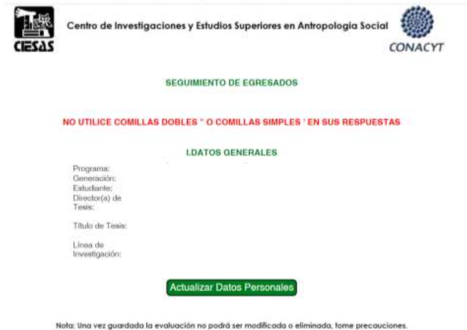
Figura 4.- Parte alta del cuestionario, sección para actualizar datos personales para contacto continuo

número de celular, presione el botón mencionado y cambie los valores, al concluir, presione Actualizar Datos , sino lo oprime no se guardarán los datos de esta sección.