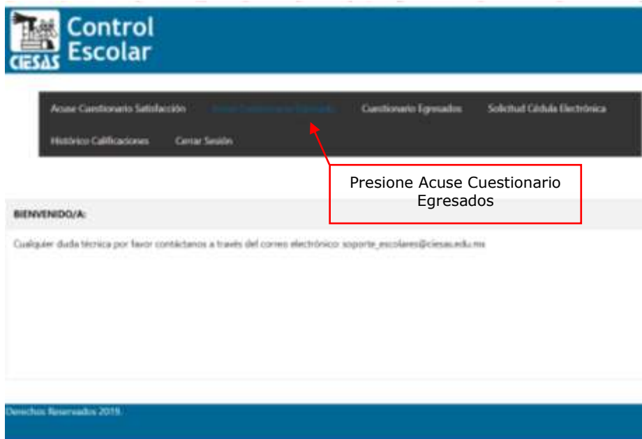
Figura 10.- Acceso al acuse de conclusión de encuesta

Una vez resuelta la encuesta de egresados, el menú principal le habilitará un botón para obtener el acuse correspondiente, imprima, firme y entregue.