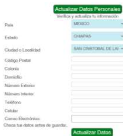
Figura 5.- Campos para actualización, de no presionar Actualizar Datos no se actualizará la plataforma

Continúe el llenado de las secciones III.FORMACIÓN ACADÉMICA, VI. TRAYECTORIA LABORAL, V. DISTINCIONES Y ORGANIZACIONES y VI. OPINIÓN Y