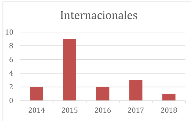
Número de convenios por año